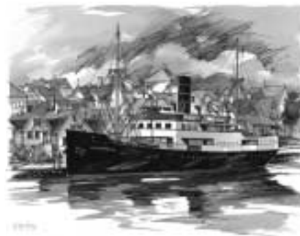
Gamle Rogaland ved Strandkaaien

For å bevare Norges største veteran-skib trenger vi all den støtte vi kan få og vi håper din bedrift vil tegne et bedriftsmedlemskapet til. 2.500,-. Personlig medlemskap koster kr. 200,- og 140,- for studenter og pensjonister.